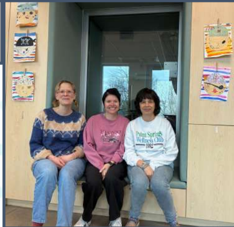
Les éducatrices du service de gard